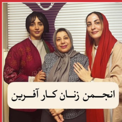
انجمن زنان کارآفرین