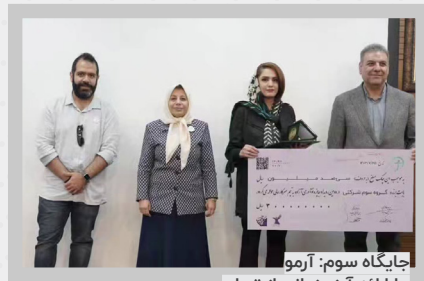
جایگاه سوم: آرمو، با ارائه آرزو زمانی از تهران